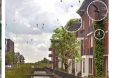
Natuur Inclusief bouwen.