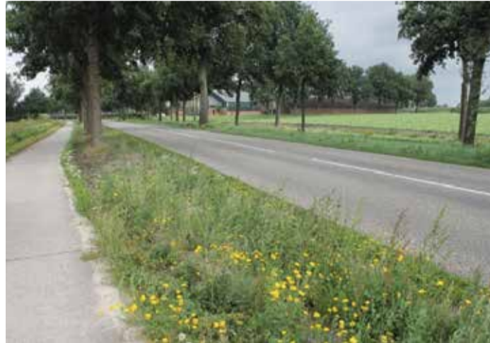
Groene bermen naast wegen.

GroenLinks wil ook dat de gemeente lid wordt het keurmerk Kleurkeur. De Vlinderstichting en Stichting Groenkeur hebben het keurmerk Kleurkeur opgezet. Deze zet in op ecologisch bermbeheer. Dit moet ons huidige plantsoen een enorme biodiversiteits-opfrisser geven. Zo moeten we minder fors gaan maaien, zeker langs auto-wegen....Laat de natuur daar haar gang gaan.