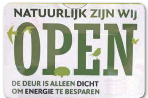
Poster voor winkels in GM.

Uit onderzoek van Universiteit van Wageningen blijkt dat open winkeldeuren (in de winter, terwijl de kachel aanstaat) een heel zichtbare vorm van energieverstopping is, dat ontmoedigt mensen om thuis moeite te doen om energieverstopping tegen te gaan. GroenLinks wil een einde aan deze zinloze energieverstopping.