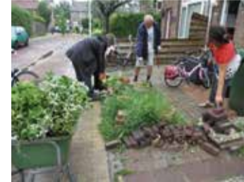
Steen eruit, Groen erin!

Het groenbeheer en de bomenkap in de gemeente wordt door een groot deel van de inwoners als rigoureuus ervaren. Dat is niet altijd terecht. We krijgen graag meer inzicht in de te kappen bomen en de compensatie daarvan. Daar moeten we beleid op maken. Wij willen dat er beleid komt, ten aanzien van natuur inclusief bouwen en natuur inclusieve landbouw, zoals stimuleren van natuurlijke akkerranden.