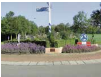
Rotonde uitbested aan hoveniersbedrijf.

GroenLinks wil dat we onze braakliggende terreinen in onze gemeente gaan inzaaien met wilde bloemen. Daarnaast willen we de rotondes in onze gemeente uitbesteden aan hoveniersbedrijven of tuincentra.