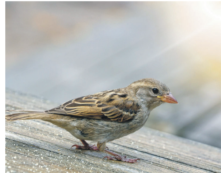
De mus vertoeft graag op erven

Woont u op een erf in het buitengebied en bent u geïnteresseerd in het verbeteren van de leefomgeving van erfvogels? Dan kunt u zich aanmelden via de website van Brabants Landschap: www.brabantslandschap.nl/ervenplus . Een deskundige komt dan uw erf onder de loep nemen om te bepalen welke maatregelen kunnen worden uitgevoerd. Met de erfscan wordt daarna een 'erfplan' met inrichtingsschets gemaakt, die aan u wordt voorgelegd. Als u het hiermee eens bent, wordt het plantgoed geleverd. Omdat voor de soortbeschermende maatregelen speciale kennis nodig is, worden deze door de lokale natuurwerkgroep begeleid. Deelname aan ErvenPlus is kosteloos. Er zijn nog enkele plekken vrij, maar vol = vol.